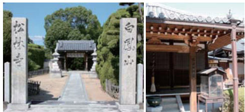
松林寺山門(左)と本堂(右)

松林寺は、真言律宗の寺院で、鎌倉時代に創建されたと伝えられています。木造不動明王坐像・二童子立像が府指定文化財、紙本著色種字両界曼荼羅図が市指定文化財となっています。本堂(弘法大師堂)には宮内法橋作の大師像が本尊として安置されています。