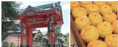
盛松寺山門(左)とユズみそ(右)

かつて弘法大師が村人の疫病治癒の祈禱を行った所(現盛松寺建立場所)にクスノキが生え、江戸時代に枯れたそのクスノキから造られた弘法大師像は「与通のお大師さん」と呼ばれるようになりました。また、弘法大師が伝授したとされる「ユズみそ」づくりは同寺の年末の伝統行事となっています。