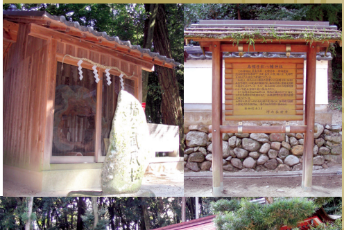
7 에보시가타하치만 신사