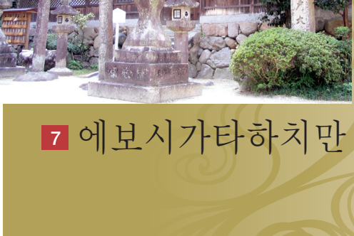
7 에보시가타하치만 신사