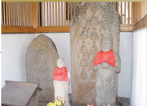
4 하라초 십삼불