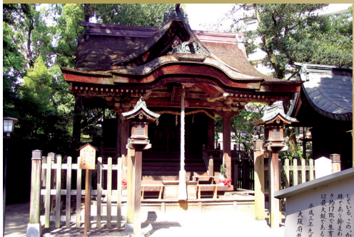
5 나가노 신사